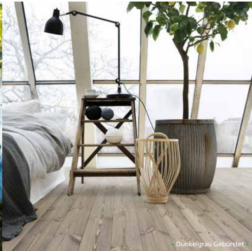
– Dunkelgrau Gebürstet –