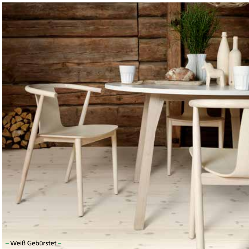
– Weiß Gebürstet –

Mit den massiven, unbehandelten Hobeldielen können Sie selber wählen, welche Oberflächenbehandlung Sie wünschen, die gerade zu ihren Geschmack und Stil passt.