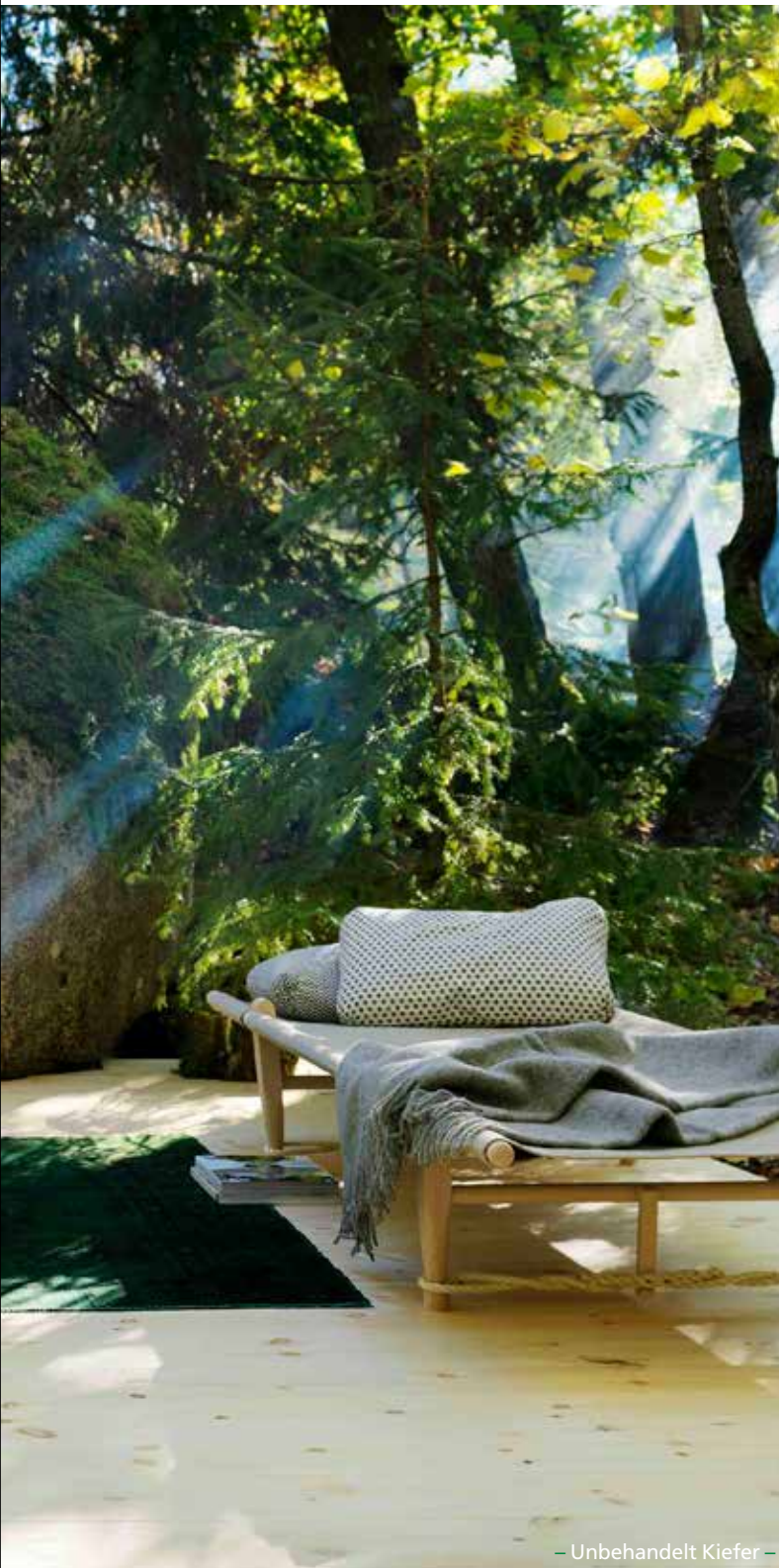
– Unbehandelt Kiefer –