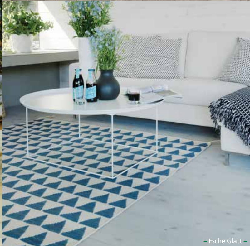
– Esche Glatt –